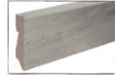
EICHE KAISERSTUHL ARTIKEL-NR. 70445 PASSEND ZU ART.-NR. 60225