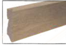
EICHE HARZ ARTIKEL-NR. 70441 PASSEND ZU ART.-NR. 60221