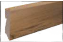
EICHE SALZBURGER LAND ARTIKEL-NR. 70449 PASSEND ZU ART.-NR. 60229