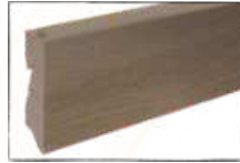
EICHE TAUNUS ARTIKEL-NR. 70444 PASSEND ZU ART.-NR. 60224