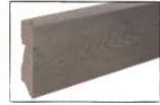
EICHE EIFEL ARTIKEL-NR. 70442 PASSEND ZU ART.-NR. 60222