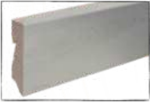
EICHE SIEBENGBIRGE ARTIKEL-NR. 70443 PASSEND ZU ART.-NR. 60223