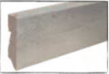
EICHE HUNSRÜCK ARTIKEL-NR. 70446 PASSEND ZU ART.-NR. 60226