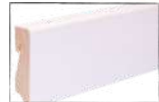
WEISS (LACKIERT) ARTIKEL-NR. 70406 PASSEND ZU ALLEN ARTIKEL