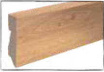
EICHE RHÖN ARTIKEL-NR. 70440 PASSEND ZU ART.-NR. 60220