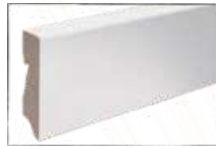
WEISS ARTIKEL-NR. 70420 PASSEND ZU ALLEN ARTIKEL