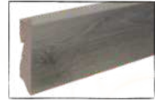
EICHE PFÄLZER WALD ARTIKEL-NR. 70448 PASSEND ZU ART.-NR. 60228