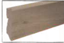
EICHE ODENWALD ARTIKEL-NR. 70447 PASSEND ZU ART.-NR. 60227